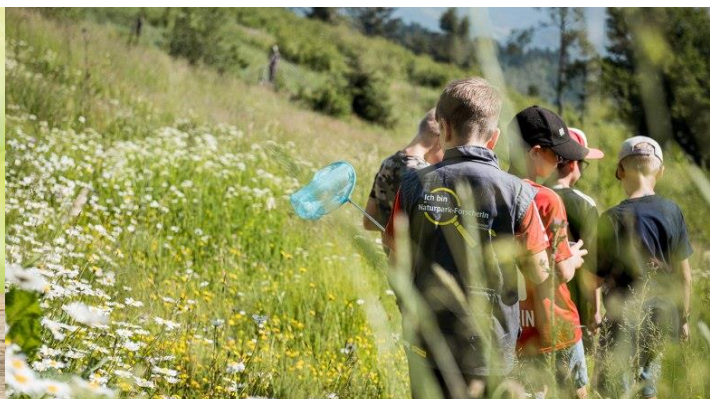
Führungsprogramme und Exkursionen