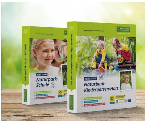
Bildungsmaterialien © Agentur Schreibeis