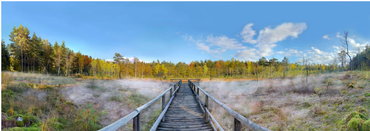
Gebietsmanagement und Informationsmaßnahmen für wertvolle Lebensräume © Horst Dolak