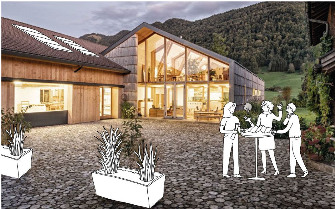
Illustration: blaugezeichnet.at